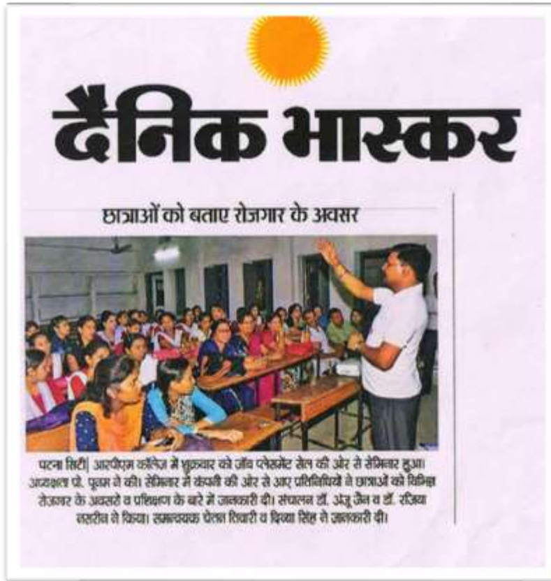
10.07.2018 Group of student gathered for training