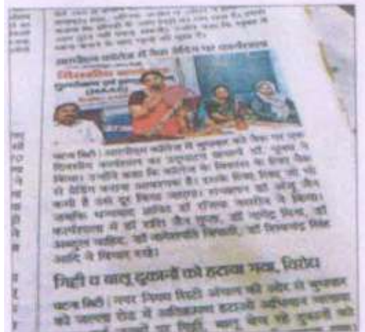
17.05.2018 opening ceremony for library and gate