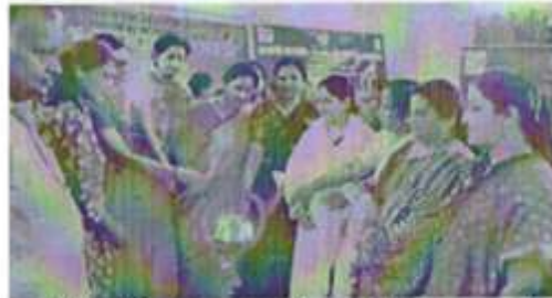
पटना सिटी, प्रांत-किरण सयाददाता

नवजात के धरती पर आने के क्षण माला को कोई भी बाहरी आहार देए बिना उसे नवजात को स्तनपान कराना चाहिए। इससे माँ और बच्चे के बीच भावनात्मक लगाव भी बढ़ता है और उसमें रोग प्रतिरोधक क्षमता भी बढ़ती है।